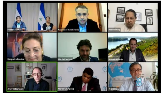
Parlementaire sessie op het IGF 2020, gehost online

De jaarlijkse IGF-bijeenkomst brengt parlementsleden uit verschillende delen van de wereld samen aan één tafel om van gedachten te wisselen over een onderwerp van wederzijds belang. Deelname van parlementsleden via nationale en regionale IGF's is een uitstekende voorbereiding om het proces te begrijpen en om specifieke input van multistakeholdergemeenschappen op nationaal of regionaal niveau naar het mondiale niveau van internetbeheer over inhoudelijke zaken te brengen.