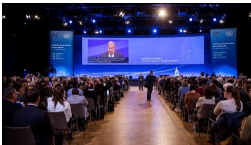
IGF 2019 w Berlinie: Otwarcie wydarzenia przez Sekretarza Generalnego ONZ oraz Kanclerz

IGF jest całorocznym procesem obejmującym doroczne spotkania oraz działania podejmowane pomiędzy nimi. Na spotkaniu IGF każdego roku gromadzą się interesariusze z całego świata w celu omówienia najbardziej istotnych kwestii związanych z zarządzaniem Internetem. Uczestnicy wydarzenia