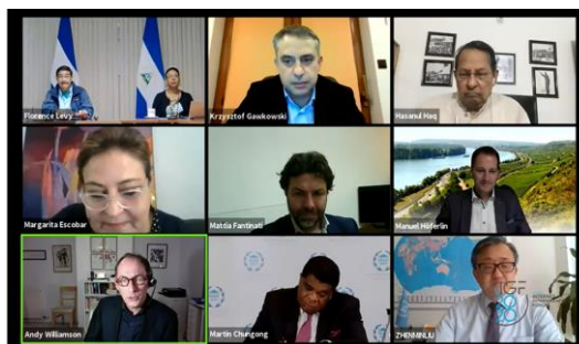
Internetowa sesja parlamentarna na IGF 2020

Na dorocznym spotkaniu IGF zbierają się parlamentarzyści z wielu krajów świata, by przy jednym stole omówić tematy będące w centrum ich wspólnego zainteresowania. Udział parlamentarzystów w tej inicjatywie za pośrednictwem krajowych i regionalnych oddziałów IGF stanowi doskonały wstęp do uwzględnienia merytorycznych głosów środowisk wielostronnych na poziomie narodowym lub regionalnym w globalnym zarządzaniu Internetem oraz lepszemu zrozumieniu całego procesu.